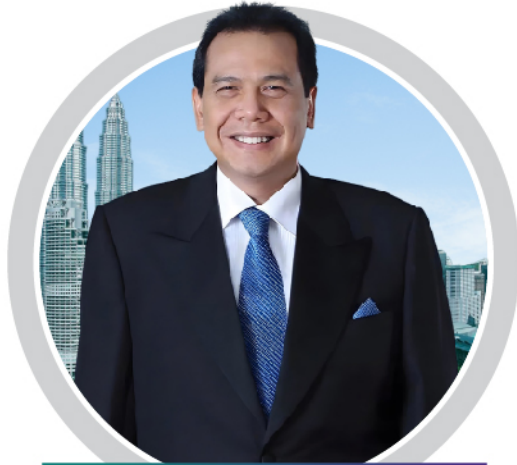
Prof. Dr. Chairul Tanjung

Pengasas & Pengerusi CT Corp., Indonesia